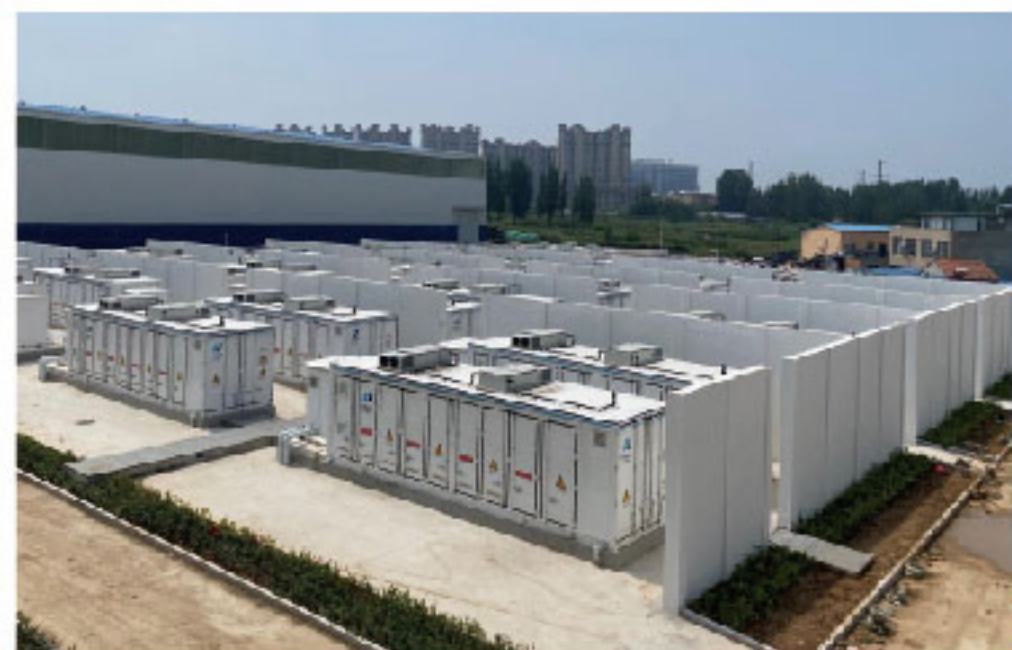
电网侧独立储系统 Power Grid Side BESS