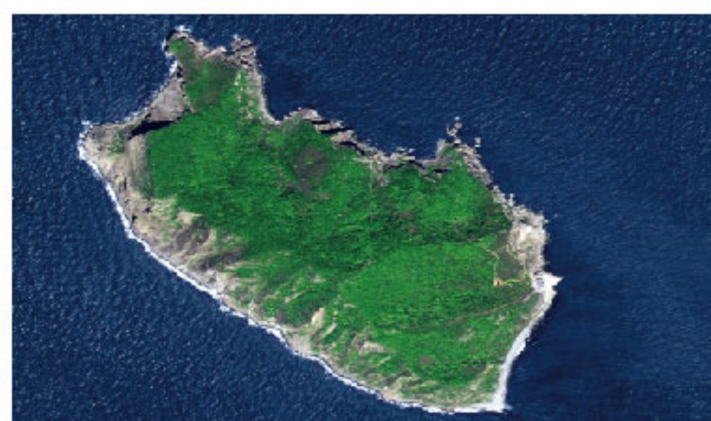
光储柴微网 Micro Grid by Solar PV, BESS and Diesel Generator