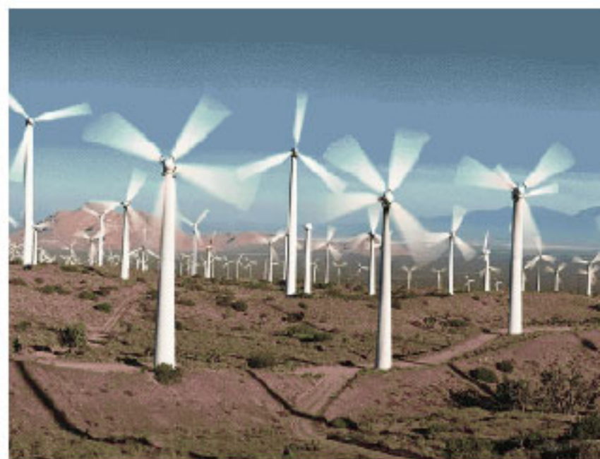
风力发电厂 Wind Power Station