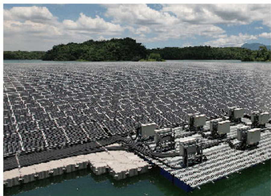
地面光伏电站 Solar PV Power Plant